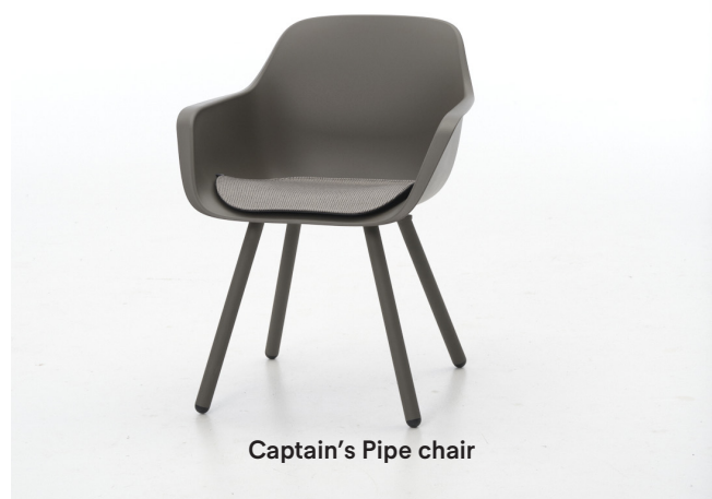
Captain's Pipe chair