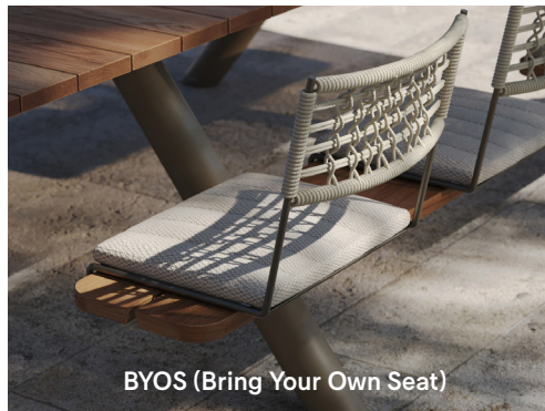
BYOS (Bring Your Own Seat)