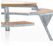
Position 3: small children