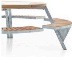
Position 1: adults