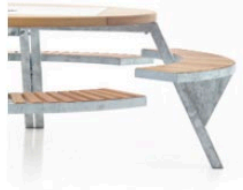
Position 2: tall children